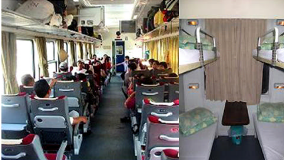
Fotos oben: Vietnamesischer Zugwagen mit „soft-seats“ // 4 Bett-Kabine Schlafwagenabteil